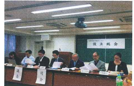
法人設立総会の様子