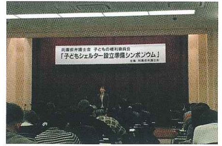
シェルター設立準備シンポジウム